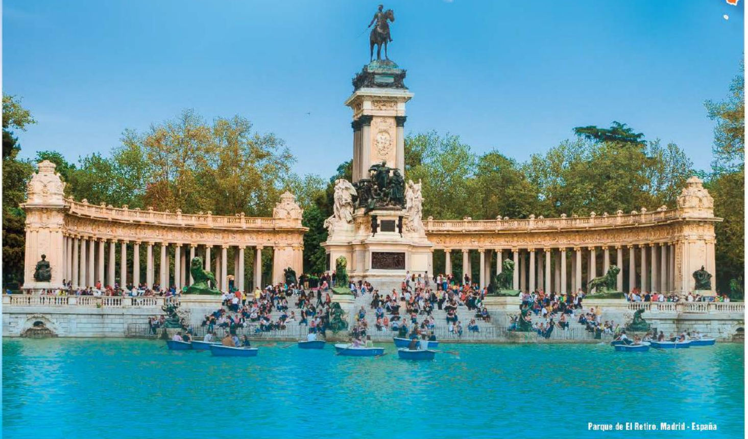
Parque de El Retiro, Madrid - España