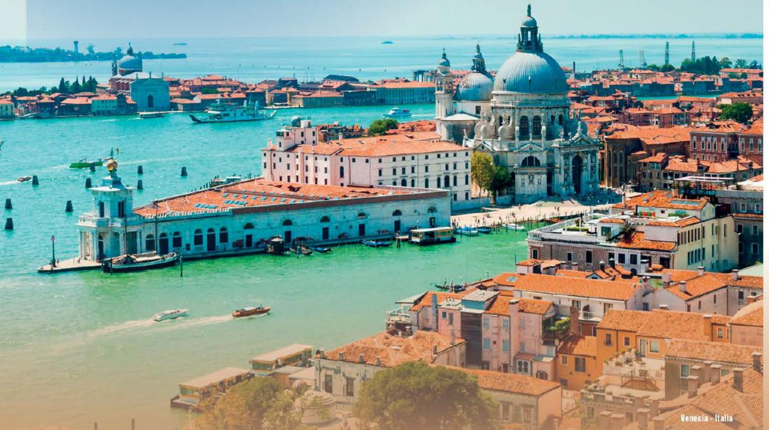
Venecia - Italia